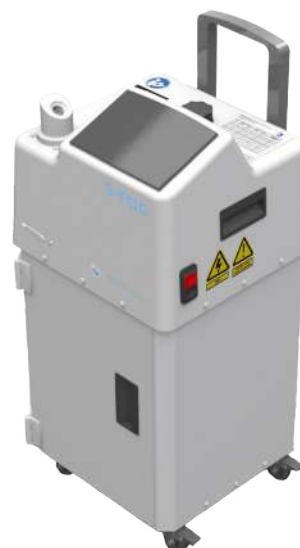
S-FOG ADVANCED PLUS